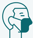
PARTE DE FORA DA MÁSCARA