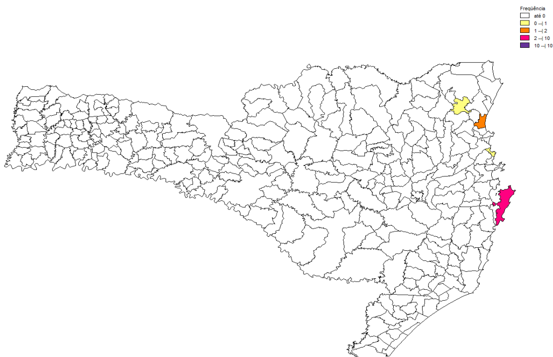
Figura 2. Distribuição geográfica dos casos confirmados em municípios com surto ativo de sarampo. Semana epidemiológica 01 a 36. Santa Catarina, 2019.